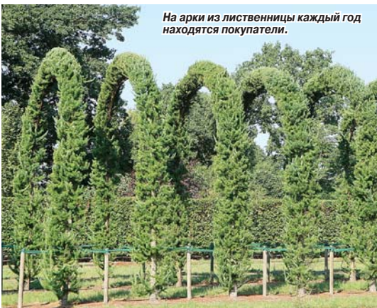
На арки из ливственницы каждый год находятся покупатели.