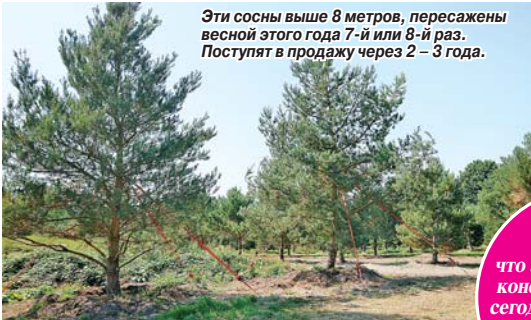
Эти сосны выше 8 метров, пересажены весной этого года 7-й или 8-й раз. Поступят в продажу через 2–3 года.