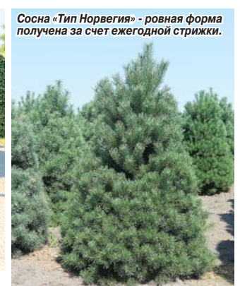
Сосна «Тип Норвегия» — ровная форма получена за счет ежегодной стрижки.