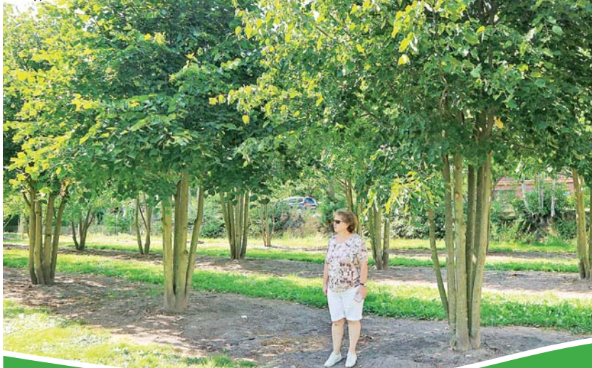
Многоствольные липы – отличный вариант для солитерных посадок.

А КАК У НИХ: ФОТОРЕПОРТАЖ ИЗ НЕМЕЦКИХ ПИТОМНИКОВ