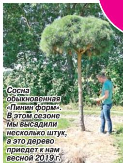
Сосна обыкновенная «Пиния форм». В этом сезоне мы высадили несколько штук, а это дерево придет к нам весной 2019 г.