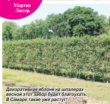
Декоративная яблоня на шпалерах — весной этот забор будет благоухать. В Самаре такие уже растут!