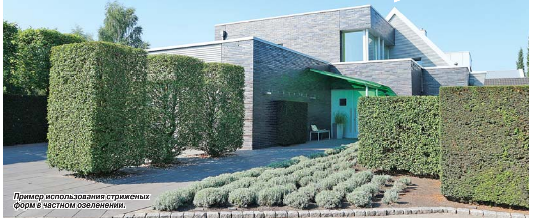
Пример использования стриженных форм в частном озеленении.