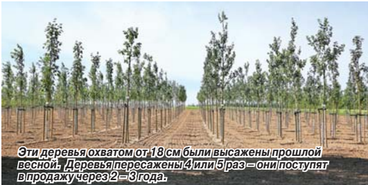
Эти деревья охватом от 18 см были высажены прошлой весной. Деревья пересажены 4 или 5 раз — они поступят в продажу через 2–3 года.