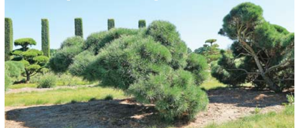
Ниваки «Унесенный ветром» из сосны обыкновенной Тип Норвегия — весной такой красавец поселился в Гранном.