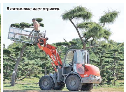
В питомнике идет стрижка.