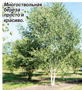
Многостовльная береза — просто и красиво.