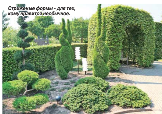
Стриженные формы — для тех, кому нравится необычное.