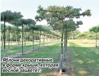
Яблони декоративные в форме крыши, которая весной зацветёт.

Мы привозим для самарских любителей живой природы растения из Германии, потому что знаем: деревья, выращенные в немецких питомниках, приживаются всегда. Посмотрите наш фоторепортаж о том, как заботятся о растениях на Родине пива и братьев Гримм.