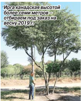
Ирга канадская высотой более семи метров — отбираем под заказ на весну 2019 г.